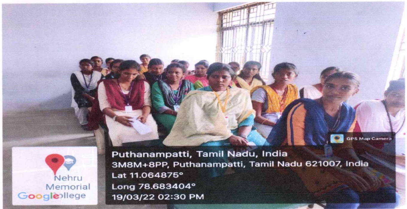
STUDENT'S PARTICIPATIONS IN BUDGET DISCUSSION 2022-2023