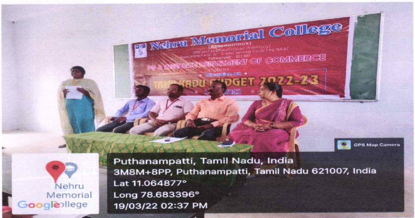
STUDENTS PRESENTING THEIR VIEWS ABOUT BUDGET 2022-2023