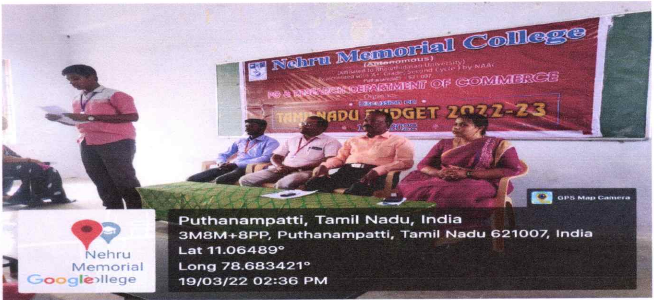
STUDENTS PRESENTING THEIR VIEWS ABOUT BUDGET 2022-2023